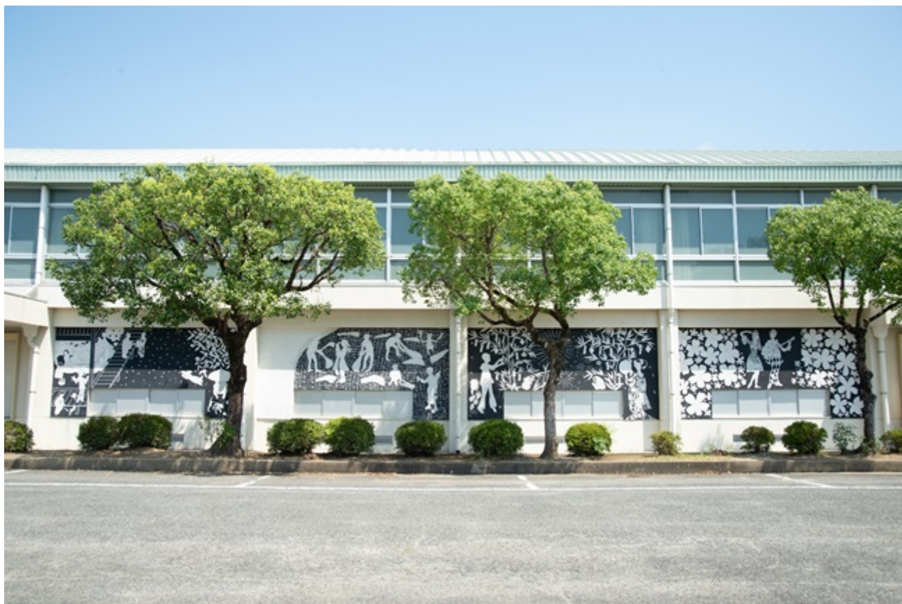
il. 1 Sgraffito w Setouchishi. Liceum Prefekturalne w Oku. 2022/2023

Tym samym został zamknięty dwuletni program realizowany w latach 2022/2023, w ramach budżetu obywatelskiego miasta Setouchishi, którego celem jest zwiększenie potencjału kulturalnego i atrakcyjności miejscowego Liceum. W jego efekcie powstały cztery dekoracje ściienne, wykonane wspólnie z młodzieżą szkoły, klubu plastycznego, w wapiennej technice malarstwa ściennego - sgraffito - zupełnie jeszcze nieznannej w Japonii.