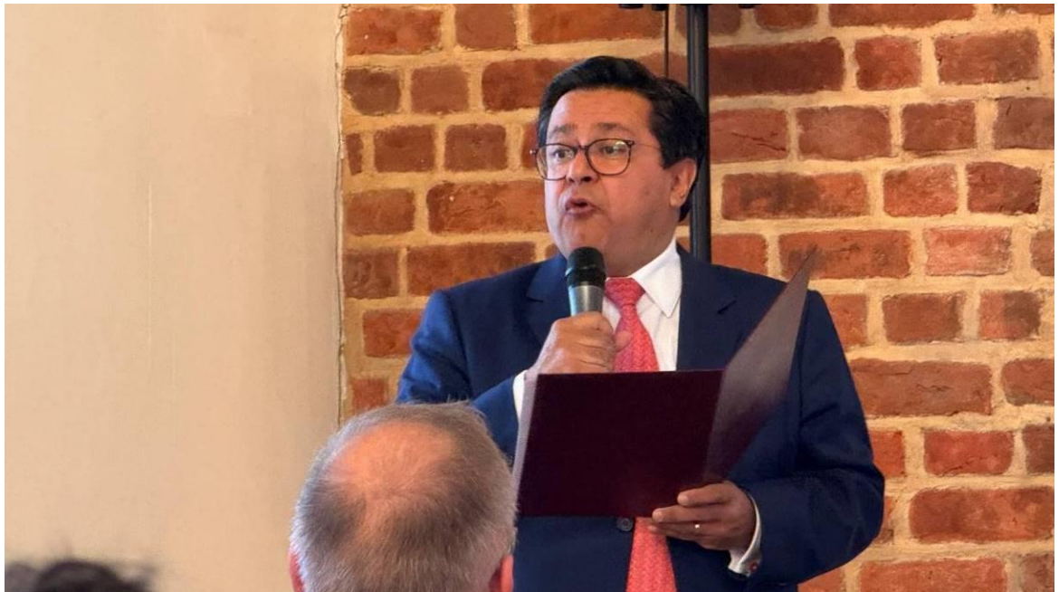
Ambasador Meksyku w Polsce, Juan Sandoval Mediolea na otwarciu konferencji